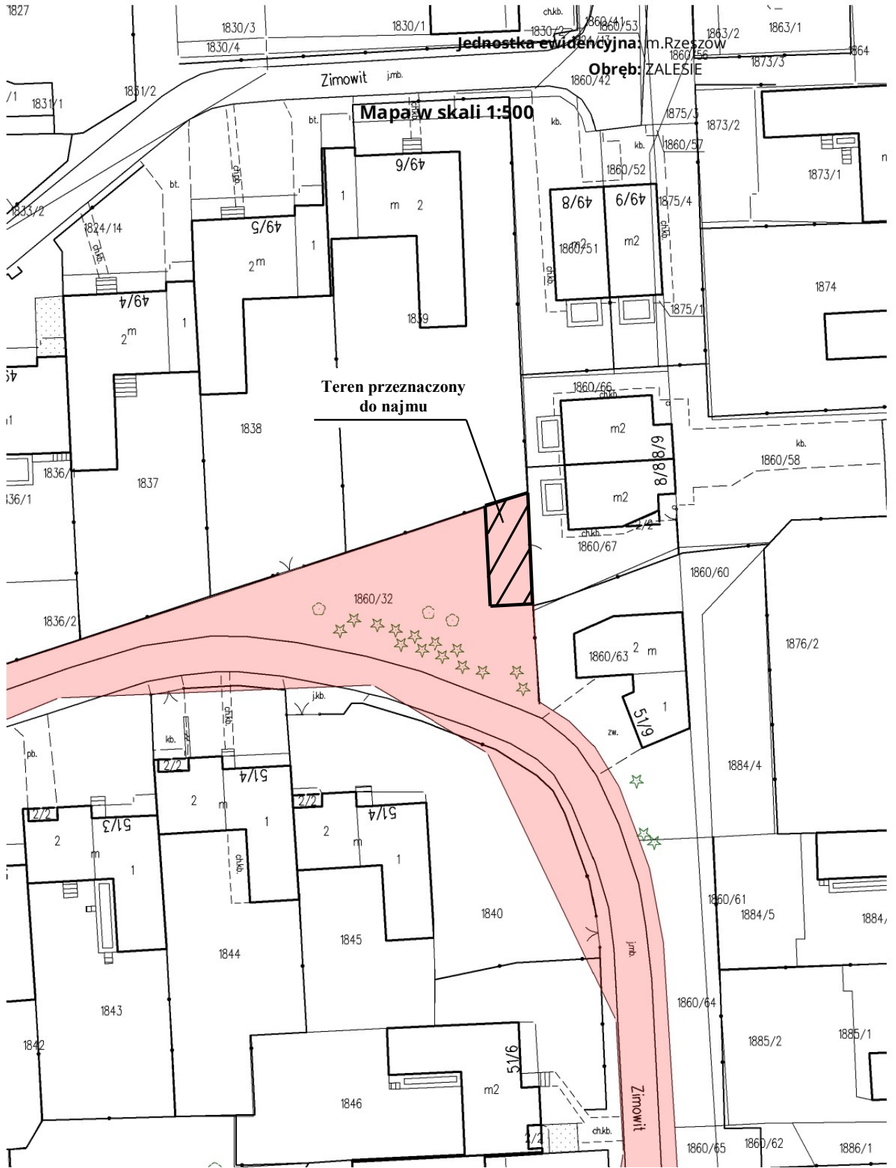
Załącznik nr 3 do Uchwały Rady Miasta Rzeszowa Nr z dnia